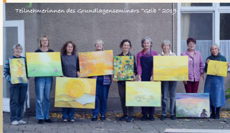
Teilnehmerinnen des Grundlagenseminars "Gelb" 2019

Im Laufe des Lebens hängt man sein Herz an beson-