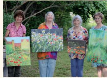
Teilnehmerinnen des Malseminars "Garten" - 2021