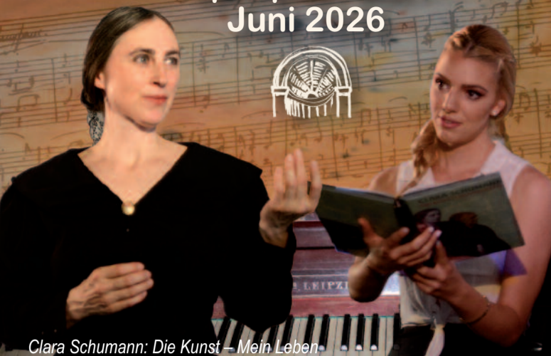
Clara Schumann: Die Kunst – Mein Leben